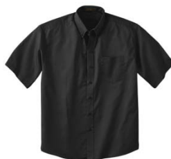
Couleur : Noir (010)