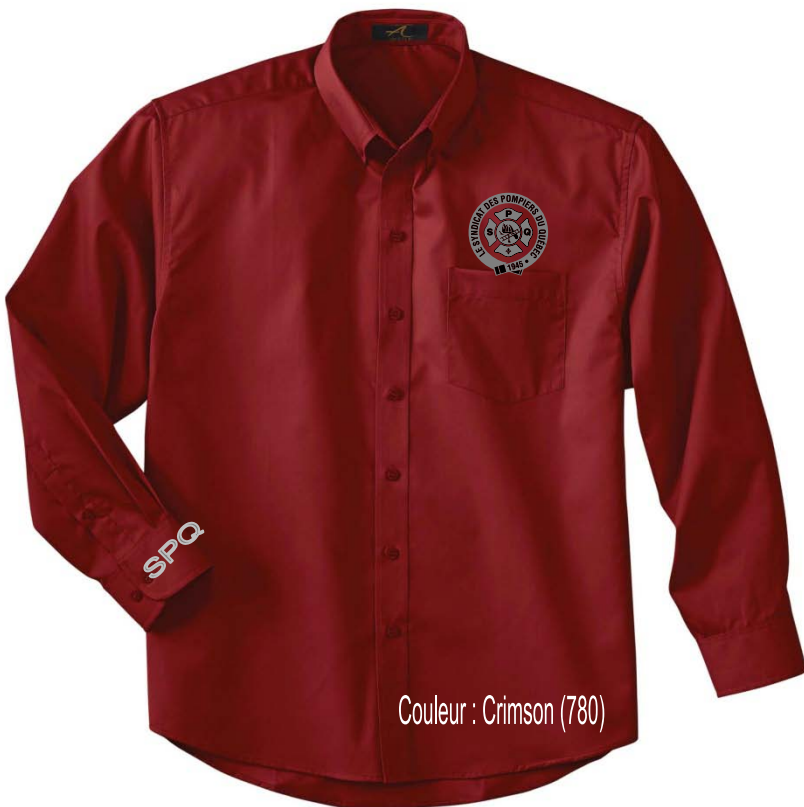
Couleur : Crimson (780)

65% polyester 35% twill de coton peigné 4.5 oz avec téflon et protection contre les UV