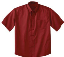
Couleur : Crimson (780)

Grandeurs : small à xx-large (xxx-large et plus ajouter 20%)