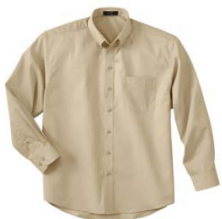
Couleur : Sand (003)

Grandeurs : small à xx-large (xxx-large et plus ajouter 20%)