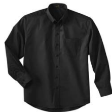
Couleur : Noir (010)