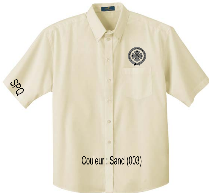
Couleur : Sand (003)

65% polyester 35% twill de coton peigné 4.5 oz avec téflon et protection contre les UV